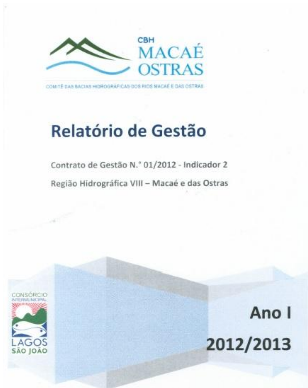
Figura 2- Capa do Relatório de Gestão - Ano I - 2012/2013