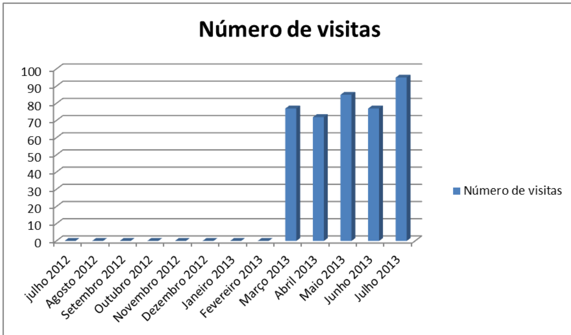
Gráfico 1 – Média mensal de acessos únicos no período de avaliação

Realizado: Média mensal de acessos únicos no período de agosto de 2012 a agosto de 2013 iguais a 83 acessos únicos.